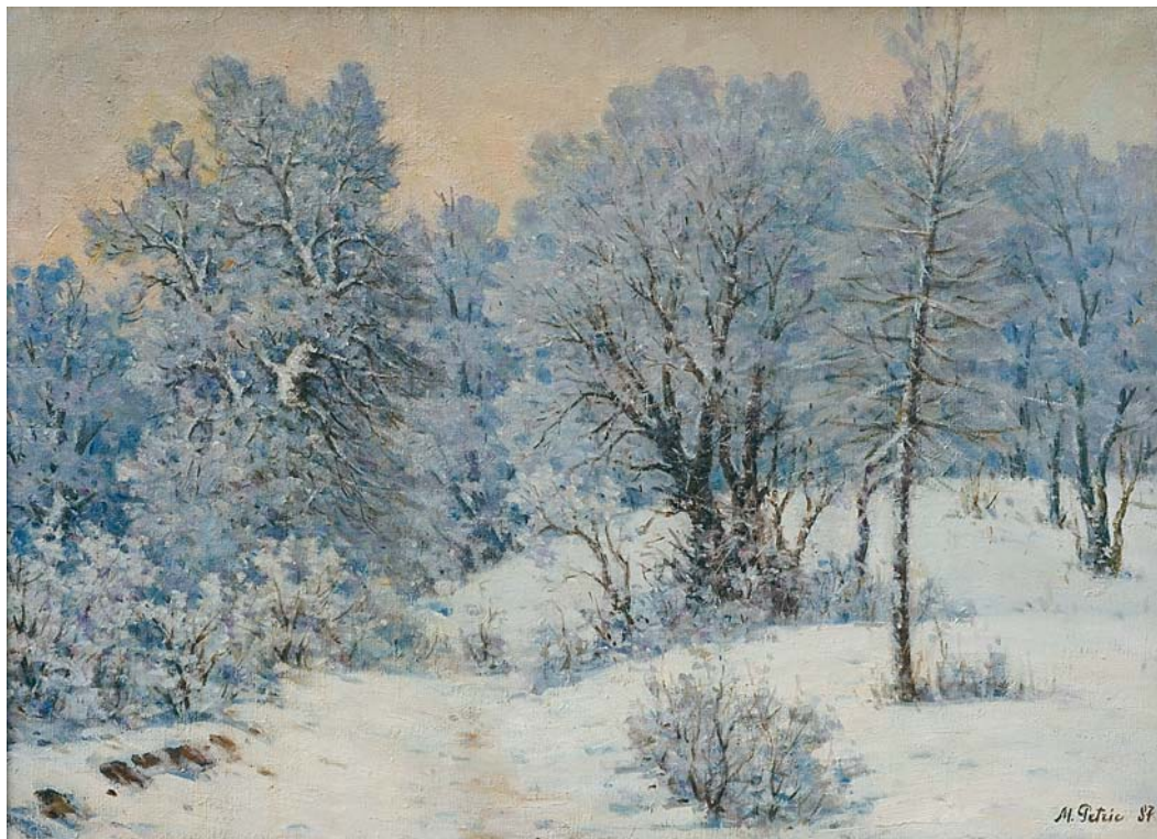
Mihail Petric. Promoroacă , u/p, 65 × 90 cm, 1987. Din colecțiile MNAM

Din alte maxime, desprinse din însemnările maestrului, mai pot fi citate următoarele două: „A lucra creator este necesar numai atunci, când inima cere” și „Izvorul de inspirație în crearea unei opere de artă e însăși viața și deoarece viața e în continuă schimbare, omul de creație trebuie să fie mereu în căutarea unor noi mijloace de întrupare a ideilor sale. Omul de creație trebuie să fie ca o albină care zboară de pe o floare pe alta, adună polenul de pe toate florile și îl preface în miere proprie, accesibilă tuturor oamenilor. El trebuie să fie mereu în căutare, dar cu grija de a nu se pierde pe sine însuși, căci numai păstrându-și individualitatea el poate prezenta interes pentru alții. Originalitatea unei opere de artă se datorează tot vieții și naturii, căci nimic nu e mai neverosimil decât adevărul ”.